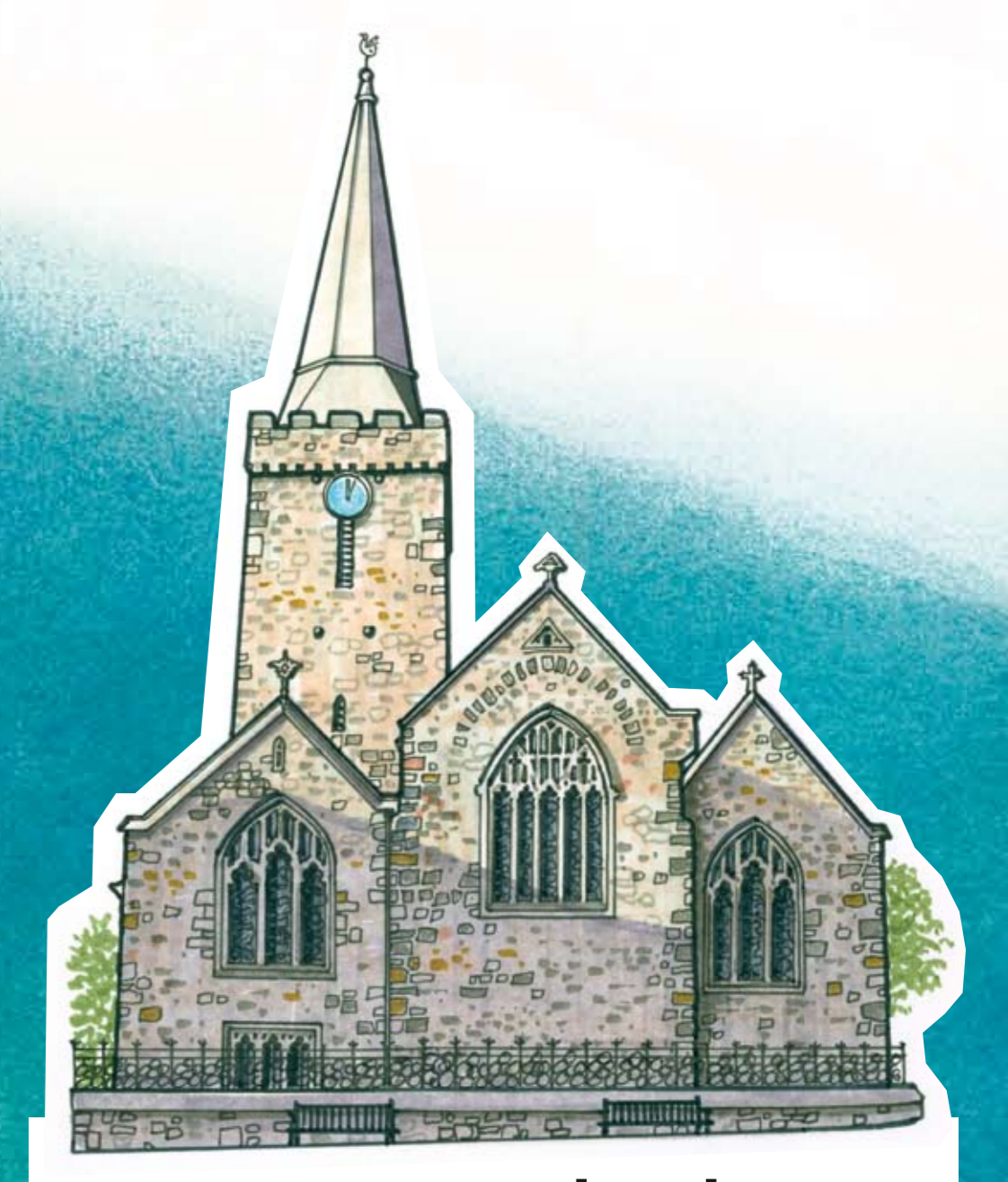
St Mary's Church