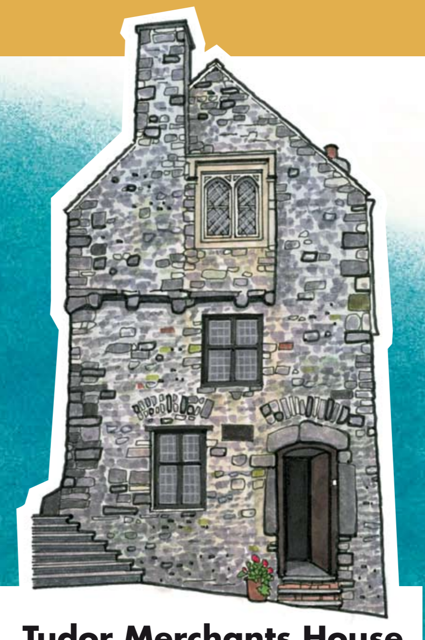
Tudor Merchants House