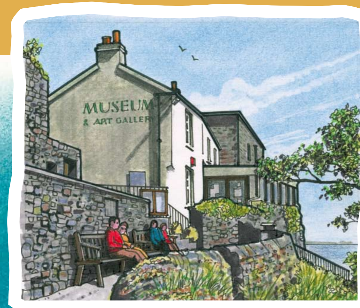
Museum and Art Gallery